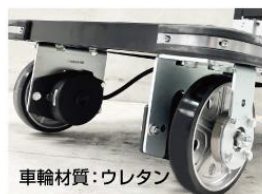
アシストキャスター